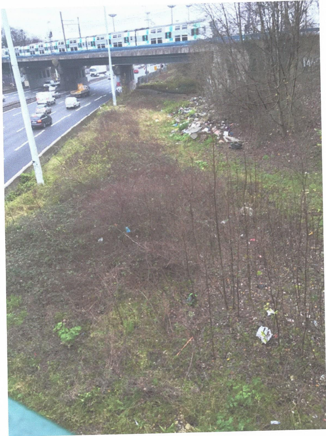
Possibilité débouché sur l'A4