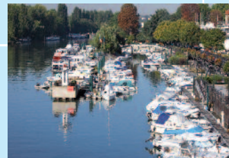
Le port de plaisance