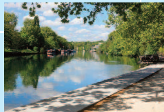
Les Terrasses de la Marne