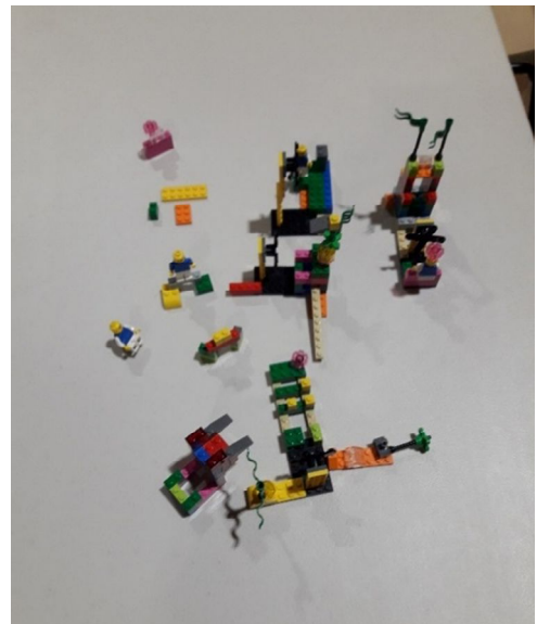
Table : La Marne : risque ou opportunité ? (4 femmes, 2 hommes)

La Marne est un bien précieux qu'il faut protéger . C'est à la fois une attractivité économique forte que l'on pourrait développer en implantant un casino, ou des bars éphémères les mois d'été (en respectant l'environnement et les riverains), mais le revers de cette forte attractivité c'est la quantité de voiture que cela pourrait générer.