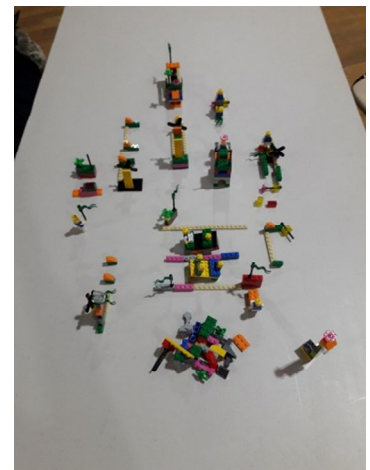
Table : Déchets : réduire, réutiliser, recycler (4 femmes)

La prise en charge des déchets passe par un investissement individuel avant tout. Nous devons changer nos habitudes d'achat et notre façon de consommer afin de réduire nos déchets