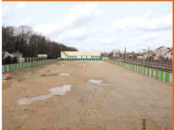
Le terrain nu.

J'espère que l'esprit de camaraderie et d'équipe qui est apparu sur le chantier, se perpétuera lors de l'exploitation du gymnase, et que tous les Nogentais qui le fréquenteront en garderont de bons souvenirs, que ce soit en tant que sportifs ou en tant que spectateurs ■