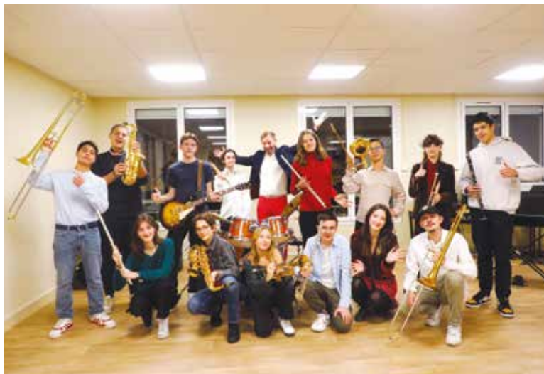
Le Big band ados du conservatoire Francis-Poulenc