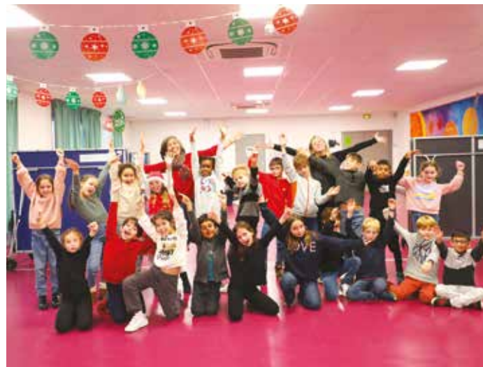
Les élèves du CE2 de l'école Victor Hugo.

Instagram et Facebook : des_mots_des_corps