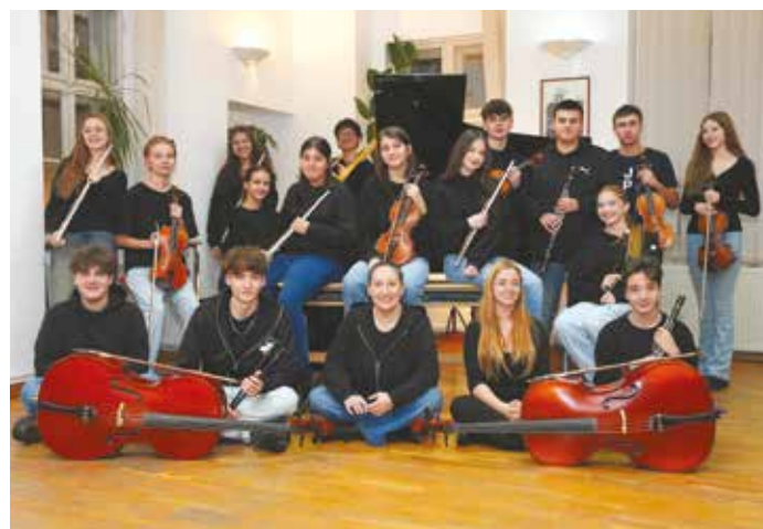
L'orchestre symphonique du lycée de musique Tudor Ciortea de Brasov

Rendez-vous le lundi 24 juin à 20h30 au Théâtre Antoine Watteau pour découvrir la prestation franco-roumaine. Une belle surprise musicale à ne pas manquer ! ■