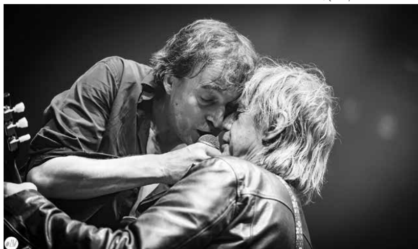
Jean-Louis Aubert et Cali