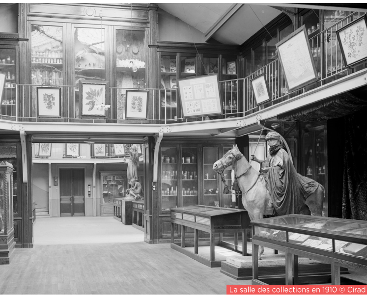
La salle des collections en 1910 - Cirad

Au fil des rayonnages, disposé en enfilade dans l'arrière-salle, se déploie le fonds documentaire relatif à l'histoire de la « mise en valeur » des anciennes colonies des régions tropicales et méditerranéennes de la fin du XIX e siècle à la fin des années 1950. Ce fonds a été labellisé CollEx (Collections d'excellence) en 2018 pour sa qualité et sa facilité d'accès. Périodiques, livres, brochures, mémoires, comptes-rendus de missions, cartes topographiques... « ce fonds s'enrichit de documents récents portant tous sur cette période et traitant de l'agriculture, des ressources forestières ou encore des productions animales » explique Dominique Lasserre. Sur la table centrale sont disposés des ouvrages, des objets sculptés, dont certains vestiges de l'exposition coloniale de 1907 ; sur les murs sont accrochés