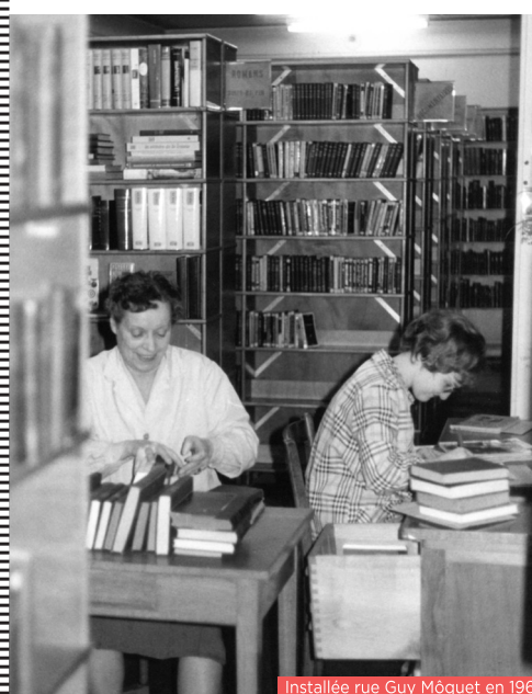
Installée rue Guy Môquet en 1966