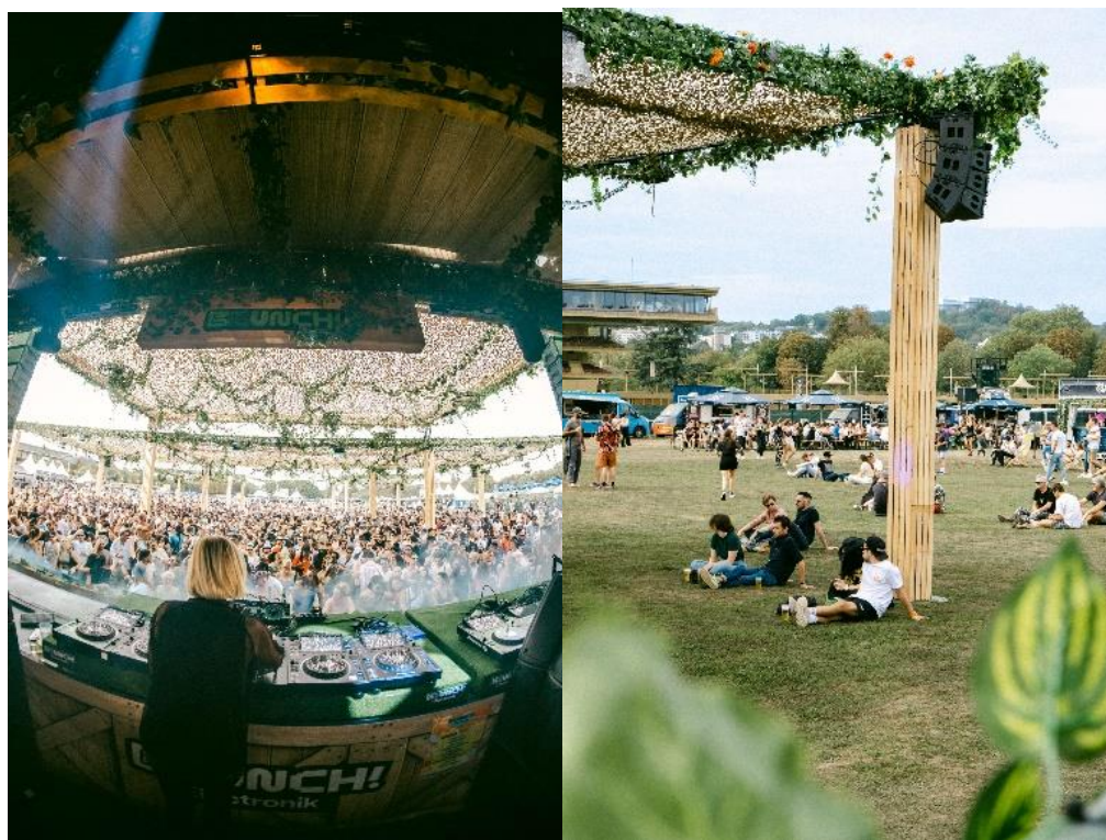
Espace Scénique et ses pergolas Brunch ! Electronik Paris 2023 – Hippodrome Paris Longchamp

Pour abriter les spectateurs du soleil, des pergolas sont réalisées à partir de poutres aluminium de section carrée.