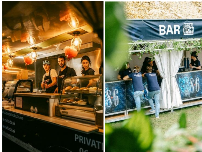
Foodtruck & Bar Brunch ! Electronik Paris 2023 – Hippodrome Paris Longchamp

L'espace de restauration : Au Brunch Electronik, la gastronomie est à l'honneur grâce aux 6 stands restauration présents chaque jour. Les options culinaires y sont très variées faisant le bonheur des carnivores et des végétariens sans oublier les options végétaliennes et Gluten free. Une aire de pique-nique est installée pour permettre aux familles de profiter d'un large choix de nourriture proposé par les food trucks locaux. Les familles peuvent aussi apporter leur propre casse-croûte et le consommer sur place.