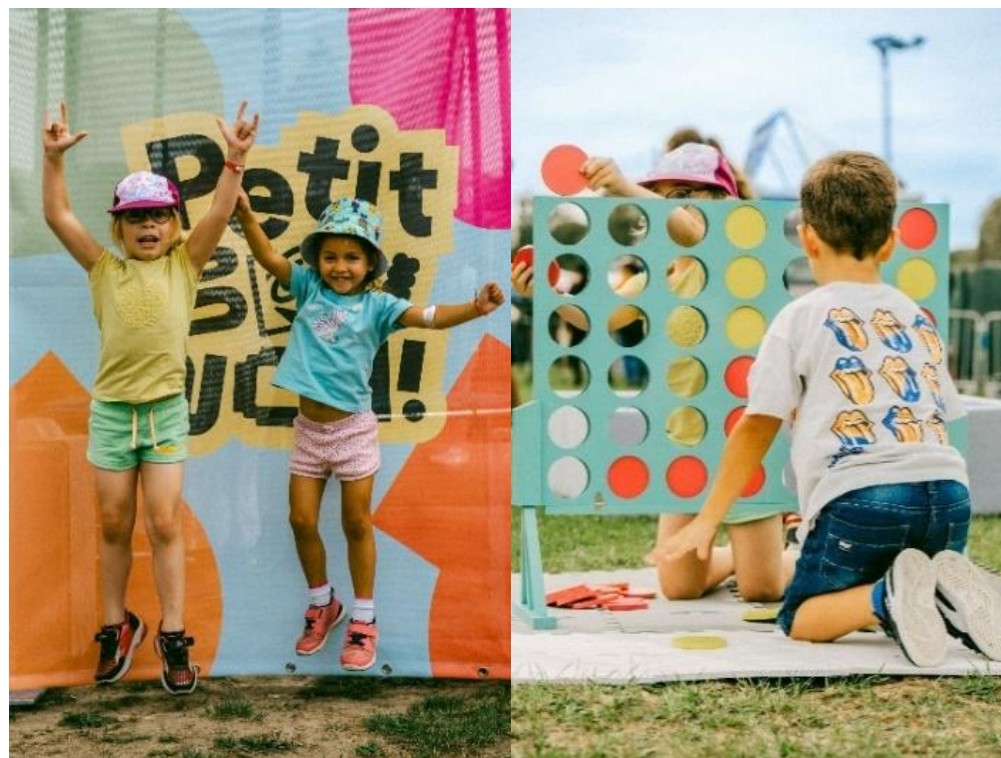
Petit Brunch Brunch ! Electronik Paris 2023 – Hippodrome Paris Longchamp

Le Petit brunch : Dans une zone délimitée par des barrières sera aménagé le Petit Brunch. De 13h00 à 17h00, familles et enfants pourront participer gratuitement à une multitude d'activités encadrées par des animateurs et animatrices et à des jeux en plein air.